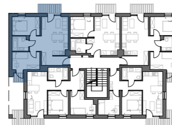
PLAN BUDYNKU NR 4