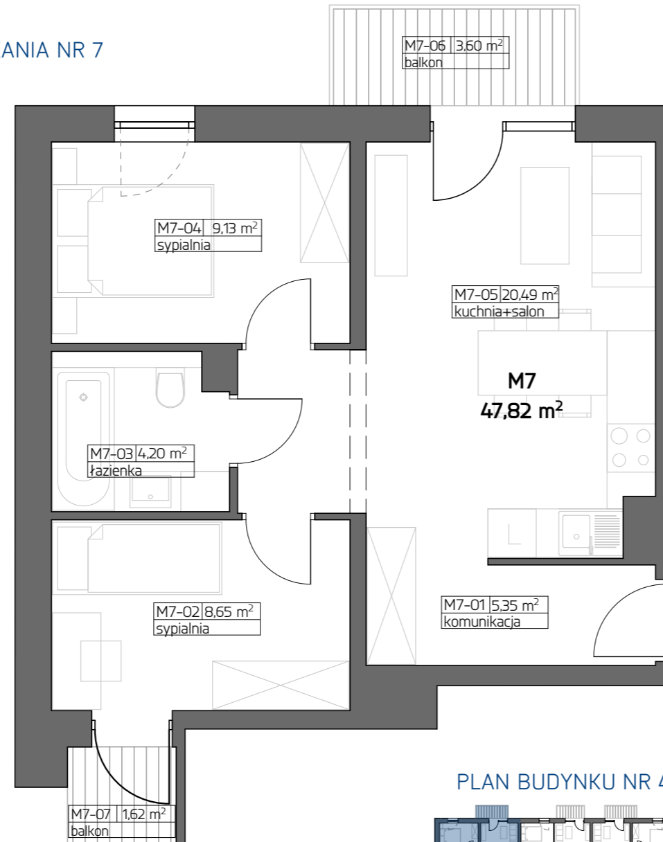
PLAN BUDYNKU NR 4