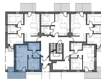
PLAN BUDYNKU NR 1