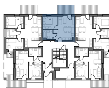
PLAN BUDYNKU NR 1