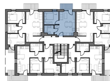
PLAN BUDYNKU NR 1