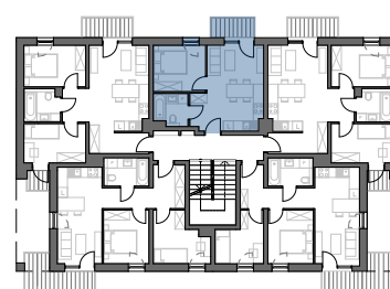
PLAN BUDYNKU NR 2